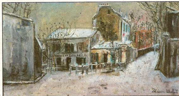
Maurice Utrillo, le lapin agile sous la neige.

Affaires culturelles de la ville de Sannois 01 39 98 21 44