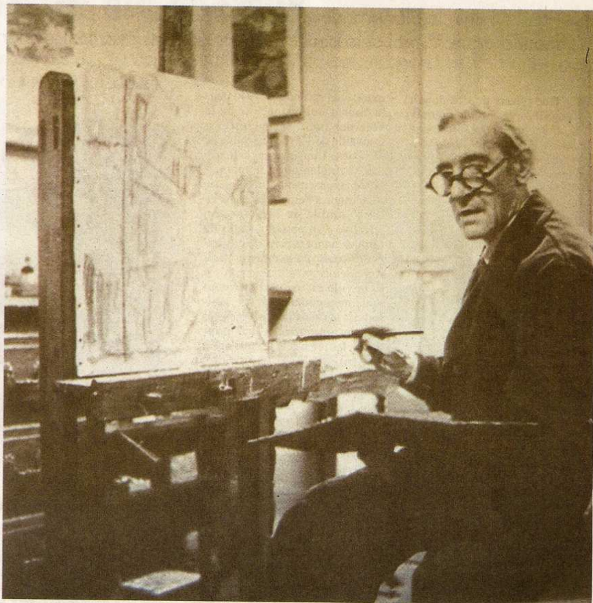
Maurice Utrillo devant son chevalet.

Site internet : www.utrillo.com et www.ville-sannois.fr