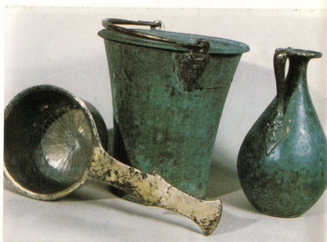
Splendides pièces de vaisselle de bronze d'époque gallo-romaine acquises en 1985 grâce au Fonds Régional d'Acquisition des Musées