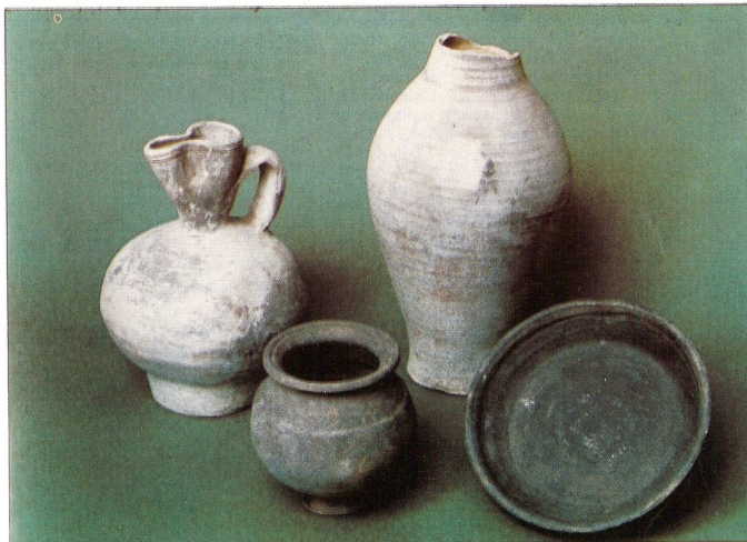
Pièces de vaisselle gallo-romaines exposées parmi les trésors du musée archéologique départemental de Guiry-en-Vexin.