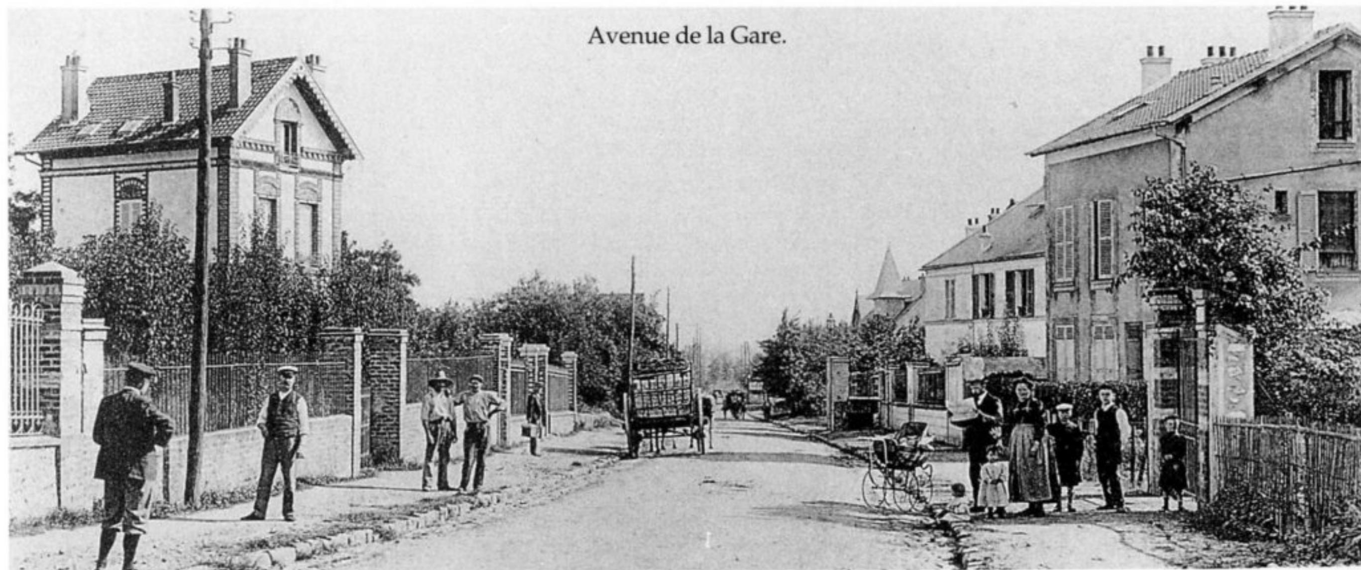
Avenue de la Gare.

La fourche entre l'ancien sentier de la Gare, devenu aujourd'hui rue de la Gare, et l'avenue