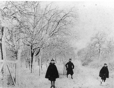
Le Chemin-Vert en décembre.

Les habitants du sud du village empruntaient un chemin parallèle, dit du Petit-Trou, actuelle rue du Chemin-Vert, pour rejoindre le chemin de la Boue jusqu'à son pont sur le Ru de Vaux, dit Pont de Montmorency, et son carrefour avec la route Impériale. Aux Quatre-Routes, le pont, détruit en 1944, ne sera pas reconstruit, car le ru sera canalisé en souterrain.