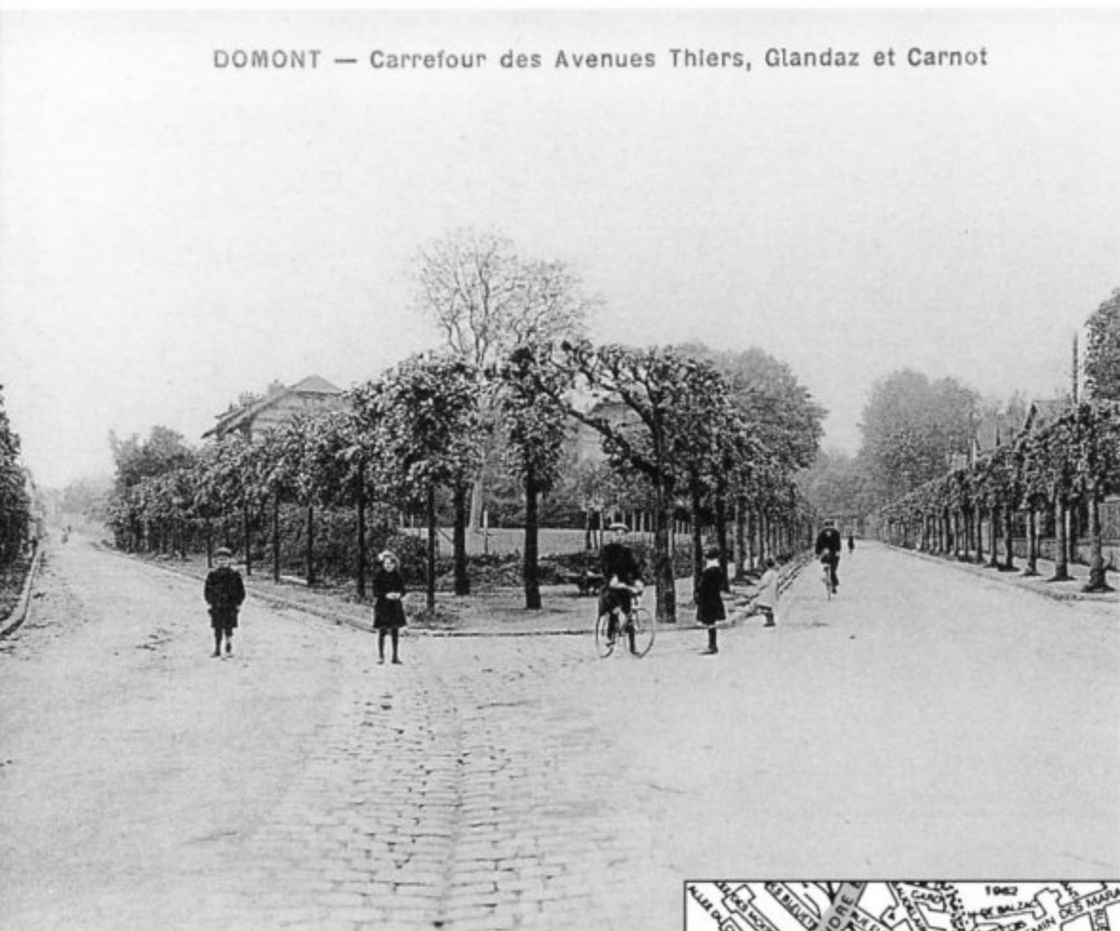
DOMONT — Carrefour des Avenues Thiers, Glandaz et Carnot