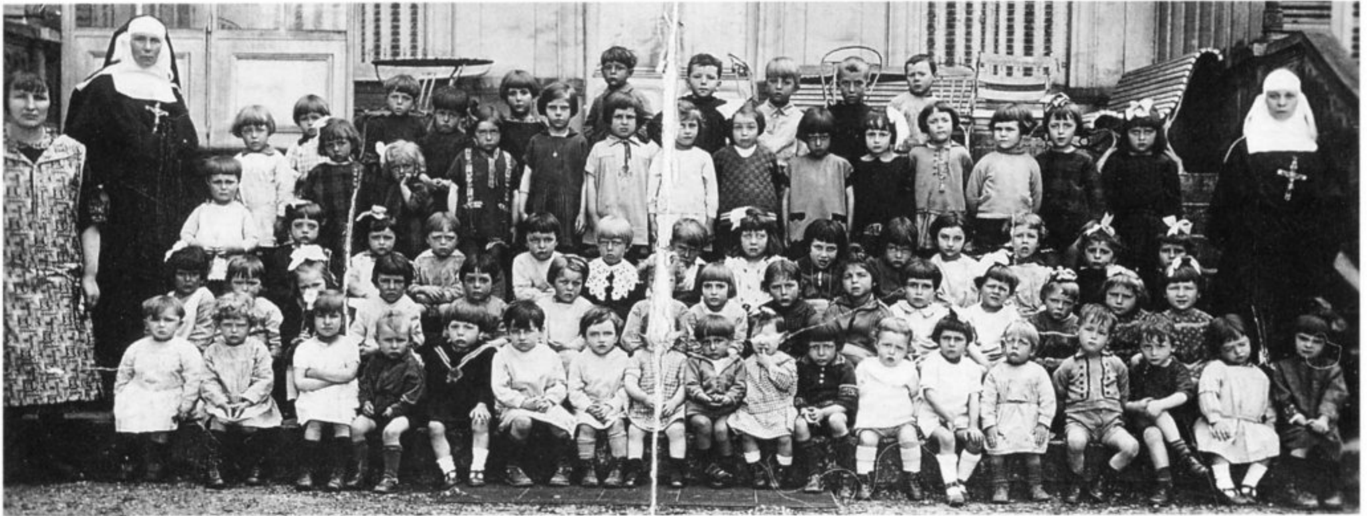
Une classe sur le perron du château du Prieuré.