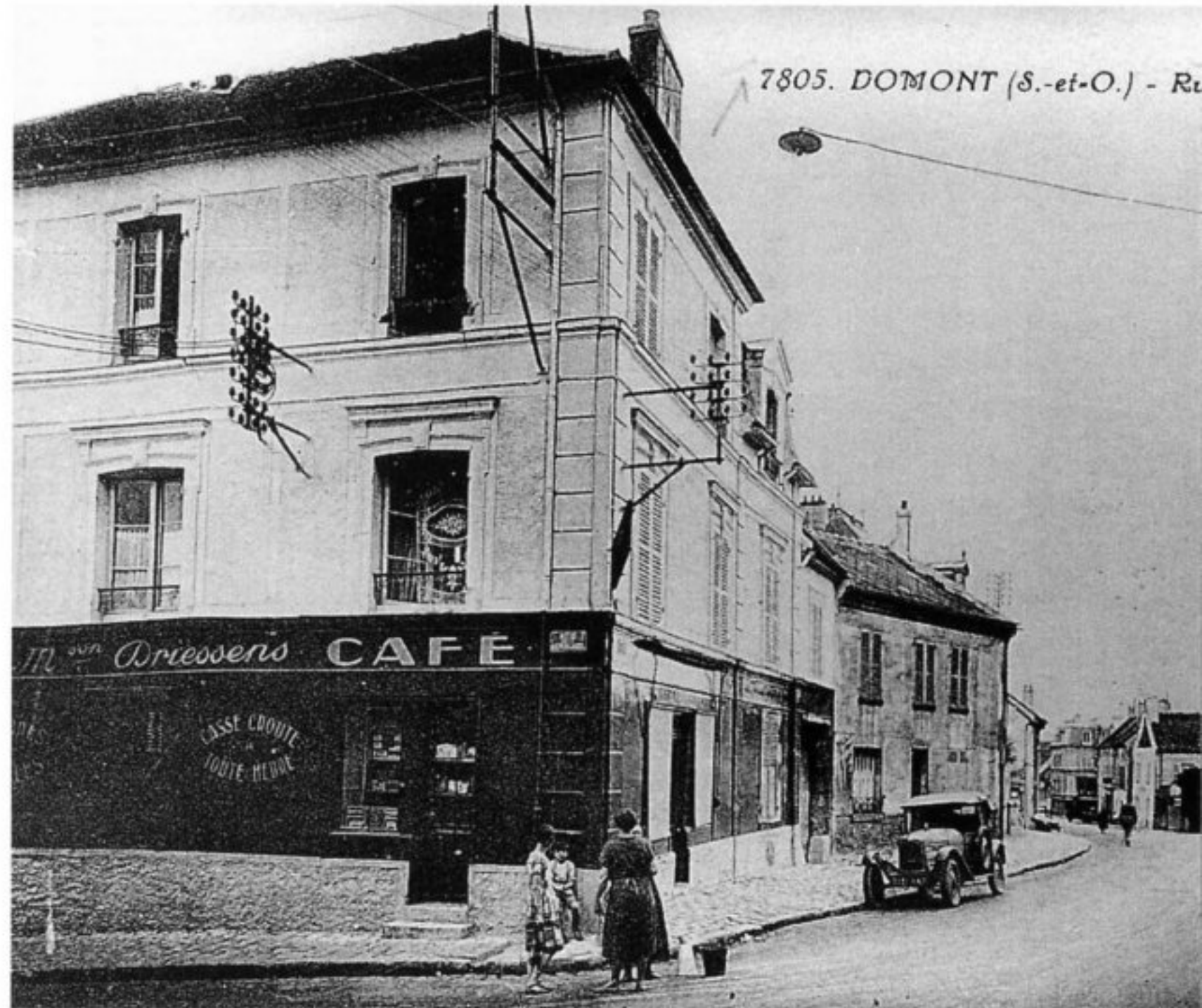
Rue de la Mairie.

L e plus photographié au début du XIX e siècle est le café Caboche, devenant ensuite Driesens, puis Disque Bleu, épicerie, bar, et restaurant. Il était bien situé, au débouché de deux entrées du village, celle de Montmorency et celle de Montlignon, à égale distance des trois places : Sablière, Mairie, Friche. Juste à côté se trouvait le local de l'Association des Ouvriers Forestiers de la forêt de Montmorency.