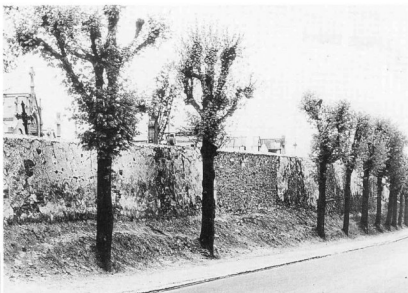
▲ Le mur du cimetière avec ses tilleuls.

Le château d'eau, chemin de la Citerne, supporte une antenne de la Société française de radiotéléphone.