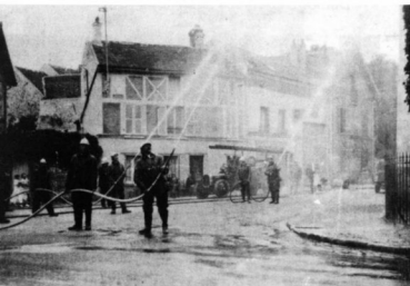
Concours de pompes à incendie, place Stalingrad.

Moins d'incendies, mais plus de malades et d'accidentés à secourir à domicile ou sur la route : l'activité des pompiers évolue, plus professionnelle et plus technique. A Domont cependant, à l'appel de la sirène, l'apport des sapeurs-pompiers volontaires, souvent employés communaux, qui consacrent leur temps de loisirs au