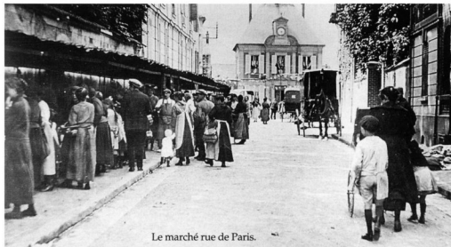
Le marché rue de Paris.

Après la guerre, la ville retint un terrain